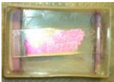
Il portaoggetti posto sui supporti nella vaschetta per la colorazione di Giemsa. Lo striscio, già colorato con il May-Grünwald, è posto sul lato inferiore del vetrino, in modo che, quando la vaschetta verrà riempita con il colorante, questo non possa lasciare depositi sul preparato