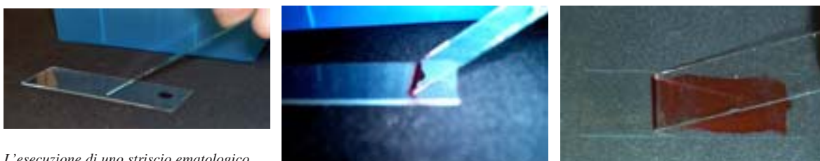
L'esecuzione di uno striscio ematologico.

Rapidamente (per evitare assolutamente l'essiccamento) si pone davanti a questa goccia, dalla parte "libera" di area maggiore del portaoggetti, il secondo vetrino (che chiamerò, per evitare fraintendimenti, " strisciatore "), in posizione inclinata di circa 30 gradi rispetto al portaoggetti di supporto (qui sotto, a sinistra).