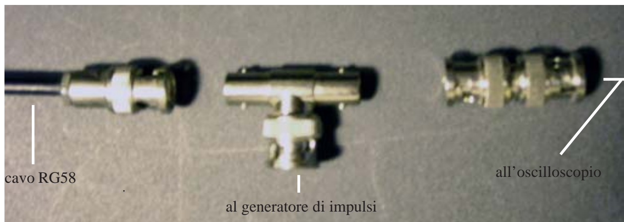
fot 7 - I connettori BNC necessari per l’esperimento.