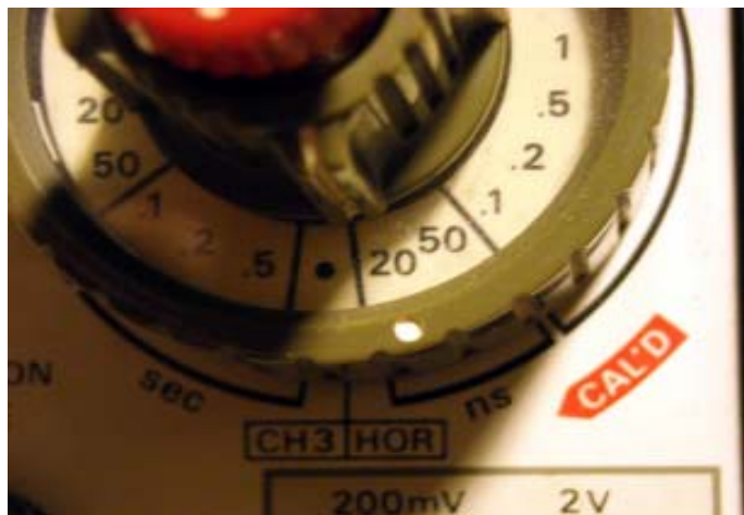
foto 1b - la regolazione della base-tempi.