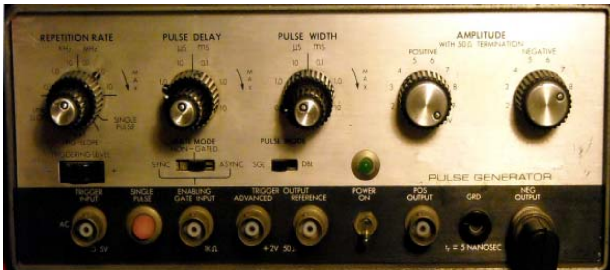
foto 2 - Il generatore d'impulsi usato per l'esperimento.