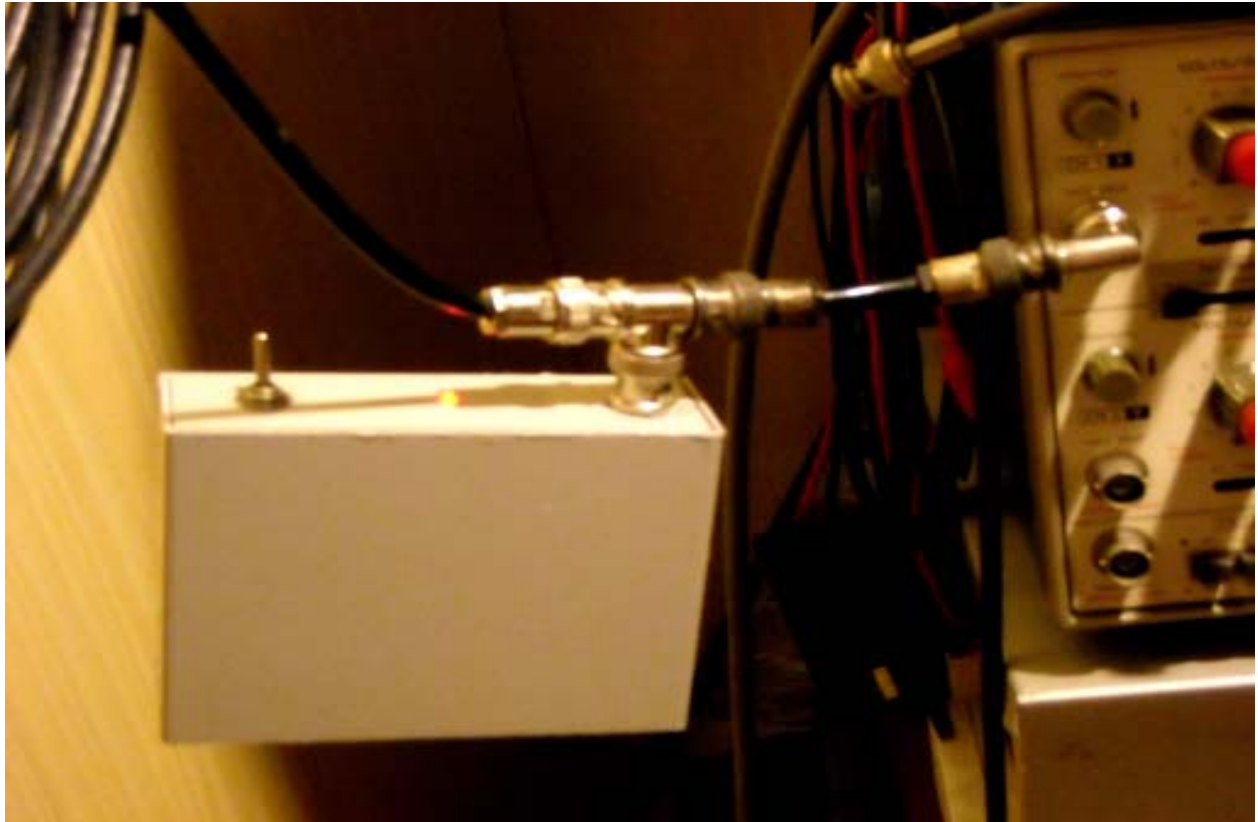
foto 6 -Il piccolo generatore d’impulsi connesso con l’oscilloscopio e il cavo RG58. Il collegamento con l’oscilloscopio è stato realizzato con 2 BNC Maschi connessi tra loro con un piccolo tratto di RG58 e un connettore BNC angolare Maschio/Femmina. Ciò si è reso necessario per motivi di... spazio tra gli strumenti.

N.B. : qualora non si conoscesse la “tolleranza” dell’oscilloscopio, potrà - in prima approssimazione - assumersi come valore \pm 2\% o anche \pm 2,5\% .