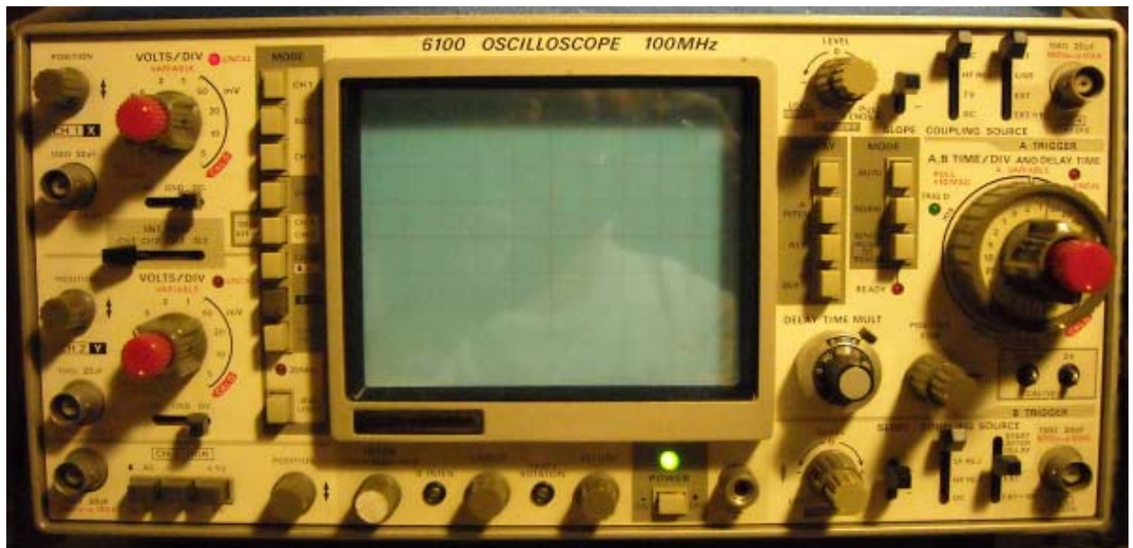
foto 1a - L'oscilloscopio usato per l'esperimento.