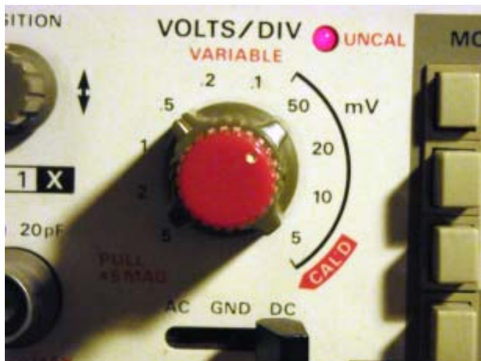
foto 1c - la regolazione dell'Asse Y.