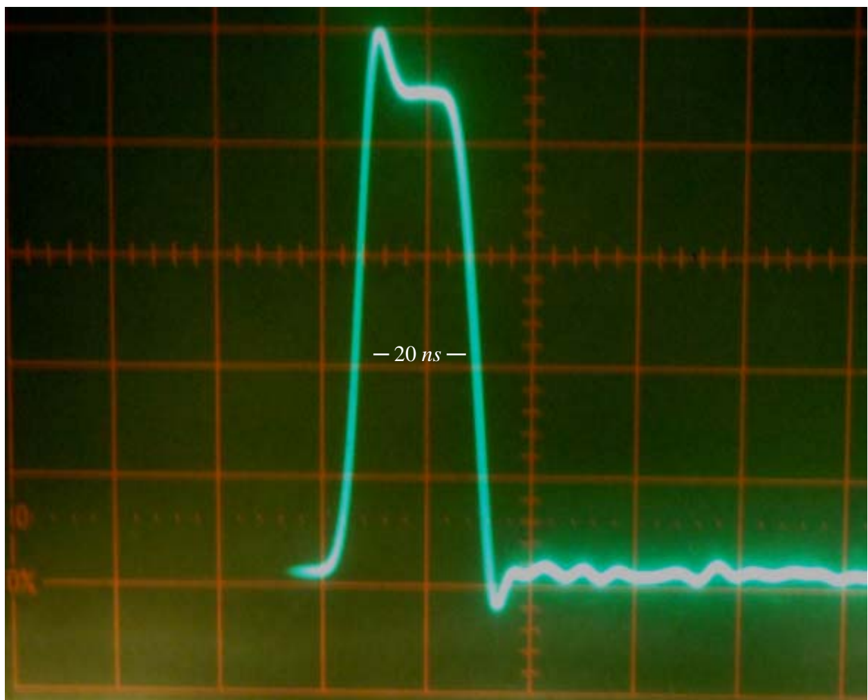
foto 3 - qui sopra: l'impulso uscente dal generatore, prima di essere immesso nel cavo RG58.